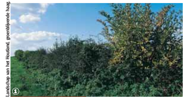
Landschap van het Houtland, groenblijvende haag.

Frans-Vlaams wallenland- schap en het moeras Audomarois, langs de oevers van de IJzer