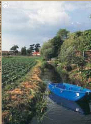
Verhuur van boten, moeras van Nieurlet.

Vanop dit punt kan u kilometers ver uitkijken over de Aa, het kanaal van Bourbourg en het kanaal van de Haute-Colme. Op deze turfrijke gronden creëerde de mens een landschap van vijvers, grachten, weiden, stukken moerasstreek en wilgenrijen; vandaag worden deze gronden gebruikt voor de teelt van gewassen. Romelaere, een voormalige exploitatiezone en vandaag een natuurreservaat met een oppervlakte van 82 hectare, herbergt een groot aantal nestvogels en overwinterende vogels zoals aalscholvers, roerdompen, woud-aapjes, eenden, bruine kiekendieven en zangvogels. In de lente weerklint het gekwaak van de