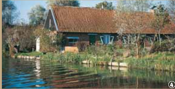
Moeras van Nieurlet, traditionele woning.