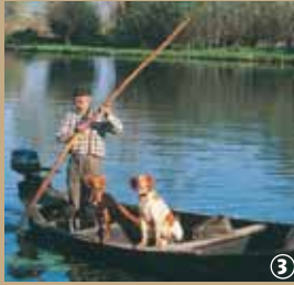
Moeras van Nieurlet.

Het moeras audomarois, dat zich op de grens tussen het Noord-Franse departement en Pas-de-Calais bevindt, gaat terug tot in de Gallo-Romeinse tijd. Toen strekte de zee zich nog uit tot Watten en was Saint-Omer een actieve havenstad. De zee trok zich terug als gevolg van erosie en klimaatwijzigingen en vandaag ligt Watten op 72 meter boven de zeespiegel.