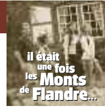
il était une fois les Monts de Flandre...

Comité Départemental du Tourisme 6, rue Gauthier de Châtillon - BP 1232 - 59013 LILLE Cedex - 03.20.57.59.59 En 2010, retrouvez toutes les infos sur les randonnées dans le Nord sur le site : www.rando-nord.fr Pour des informations générales sur le tourisme : www.tourisme-nord.fr