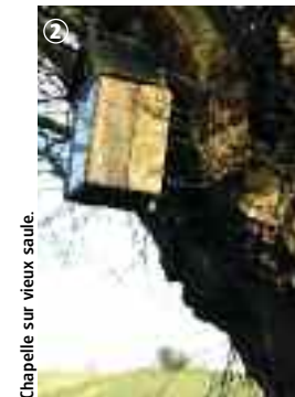
Chapelle sur vieux saule.