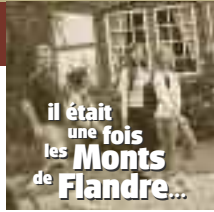
il était une fois les Monts de Flandre...