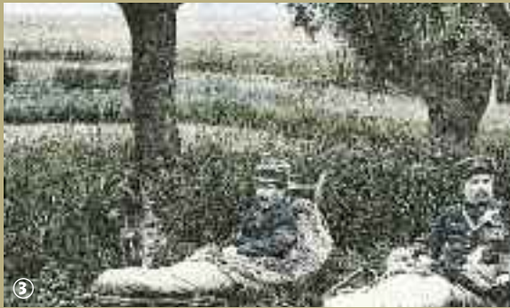
Douaniers dans leur lit de camp.

La fraude, une bien étrange activité, qui fait la renommée du village de Godewaersvelde. Vers les années 1850, quand les frontières économiques existaient encore, de nombreux Flamands pratiquaient le libre-échange à leur manière : ils empruntaient les chemins de traverse les poches pleines de tabac de contrebande. Quelle aventure ! Que de subterfuges imaginés pour éviter les douaniers ! Car eux aussi étaient de la partie. Munis d'un sac de couchage en peau de mouton sur le dos et d'un lit pliant appelé pour l'occasion lit d'embuscade, ils veillaient la nuit à l'affût des contrebandiers. Depuis 1994, un géant rend hommage à ces « empêcheurs de tourner en rond ». Il s'appelle Henri le douanier de Godewaersvelde, en souvenir de l'ancien douanier Henri Dupont. Haut de 3,80 m pour