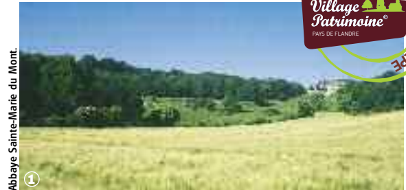
Abbaye Sainte-Marie du Mont.