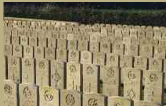
Tombes militaires du Commonwealth.

livre « chemins et chapelles » de partir à la rencontre des chapelles des Monts de Flandre, à pied, à cheval, à vélo ou en voiture.