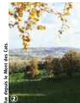
Vue depuis le Mont des Cats.