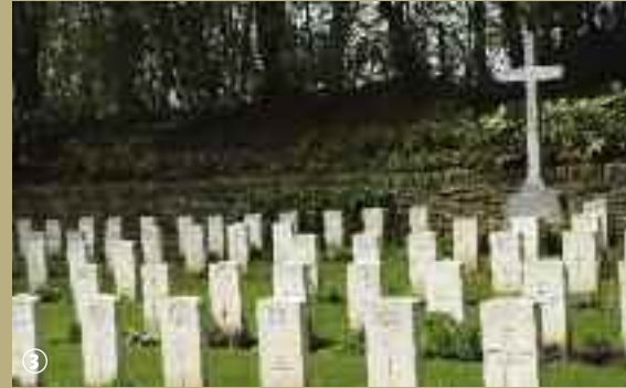
Cimetière britannique du Mont Noir.

Et pour poursuivre leur découverte, L'Office de tourisme des monts de Flandre propose à travers un