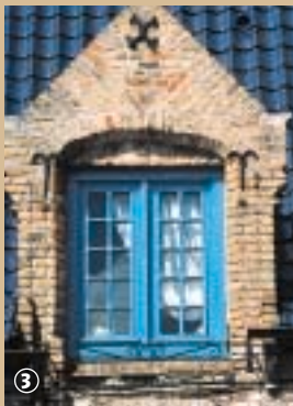
Verniste, Vlaamse dakpannen.

Hef de ogen ten hemel en kijk aandachtig naar de daken van de Vlaamse woningen. De daken in het noorden van Frankrijk hebben het typische kenmerk dat ze bedekt zijn met S-vormige dakpannen. Het gebruik van de dakpan in het algemeen dateert uit de Gallo-Romeinse tijd. In Vlaanderen deed de dakpan pas zijn intrede in de Middeleeuwen. Ze ondervond veel concurrentie van het stro, dat vaak als dakbedekking werd gebruikt op het platteland, terwijl dakpannen vaak veel werden toegepast in bouwwerken van de edelen en in kerken en kastelen. Deze dakpan, die ook wel Vlaamse dakpan wordt geheten, dankt zijn kronkelige vorm aan zijn voorouders: in één