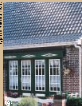
Typisch Vlaams huis.

En Frans-Vlaanderen zou niet het traditionele Vlaanderen zijn zonder de opmerkelijke architectuur van de huizen en zonder de hagen langs de wegen. Om deze variëteiten beter te herkennen, worden de struiken en planten gegroepeerd in een arboretum langs de route, dat elke wandelaar, ongeacht van waar hij of zij afkomstig is, inwijdt in de fysiologische kenmerken van deze variëteiten. Hulst, meidoorn, kamperfoelie... , geen enkele van deze planten-variëteiten zal nog geheimen voor u hebben.