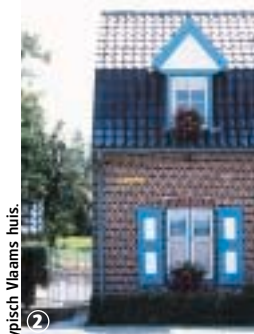
Typisch Vlaams huis.

Lange route die u laat kennismaken met een grote patrimoniale rijkdom. Langs deze route, die symbool staat voor de streek van Cassel, ontdekt u de traditionele woningen en de architectuur van de bofsteden, de bergen, de kapelletjes, de opmerkelijke kerkkerken en de typische landschappen van het Houtland. Om het nuttige aan het aangename te koppelen, moet u gewoon even balt houden aan een van de plaatselijke cafeetjes.