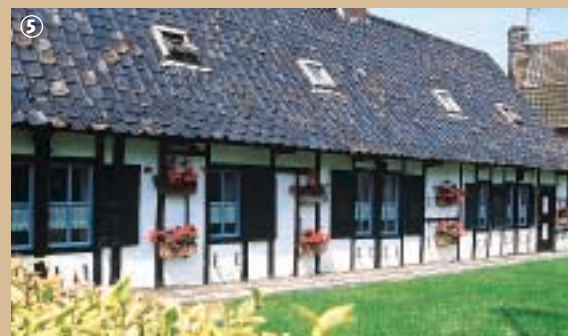
Vlaams huis in Terdeghem.

enkel dakpan wordt immers het hoge en het holle deel van de Romeinse dakpan weergegeven. Een ander origineel aspect van de Vlaamse dakpan is de kleur: met haar oranje- en zwartblauwe kleuren straalt deze